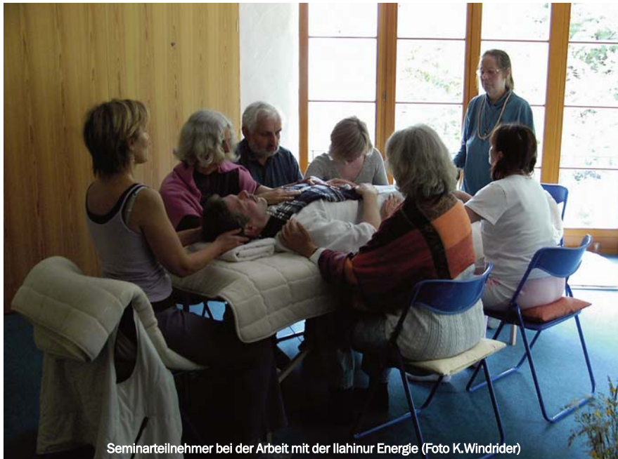
Seminarteilnehmer bei der Arbeit mit der Ilahinur Energie

„Das Portal zur Ewigkeit“, eine Anleitung zum planetaren Aufstieg.